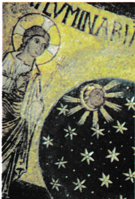
Crearea soarelui, lunii și stelelor (mozaic, Bazilica San Marco, Veneția, sec. XII)