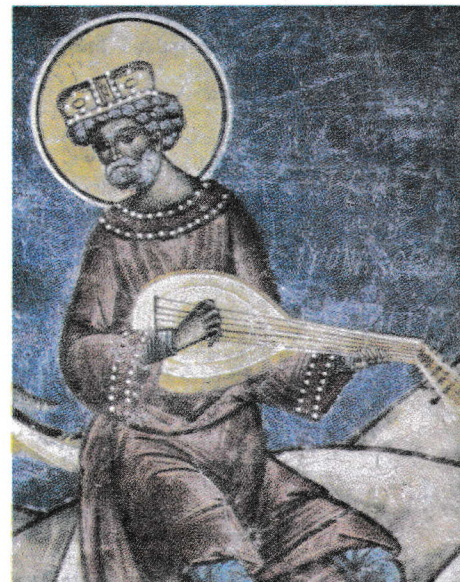
Prorocul David (detaliu frescă, Mănăstirea Voroneț, sec. XV)

Prin descoperirile din perioada Vechiului Testament, lumea a fost pregătită pentru primirea lui Iisus Hristos, Fiul lui Dumnezeu, ca Mântuitor al întregii lumi. Sf. Apostol Pavel scrie: „În multe rânduri și în multe feluri grăindu-le Dumnezeu părinților noștri prin profeți, în zilele acestea de pe