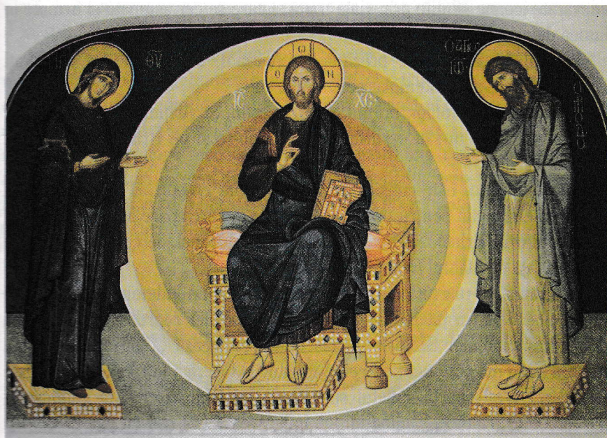
Deisis (frescă de Maria Mirea, sec. XX)

„Întipărește-ți pe Hristos în inimă, acolo unde El locuiește deja; dacă citești despre El într-o carte sau Îl privești într-o icoană, El are să ilumineze cugetarea ta, ca să-l cunoști îndoit, prin cele două căi de percepere prin intermediul simțurilor. Astfel, tu vei vedea cu ochii ceea ce ai învățat prin cuvânt. Cel care aude și vede în acest fel, în ființa sa totul va fi umplut cu lauda lui Dumnezeu”.