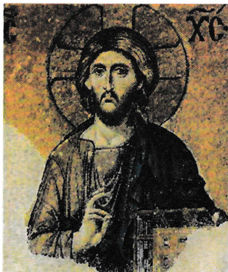
Hristos Pantocrator (mozaic, Biserica Sf. Sofia, sec. XIII)

„Canonizarea iconarilor înalță arta sacră pe drumul sfințeniei și, pe de altă parte, viziunea lor harismatică și în același timp bisericească face din icoană un loc teologic și deci una din sursele teologiei.”