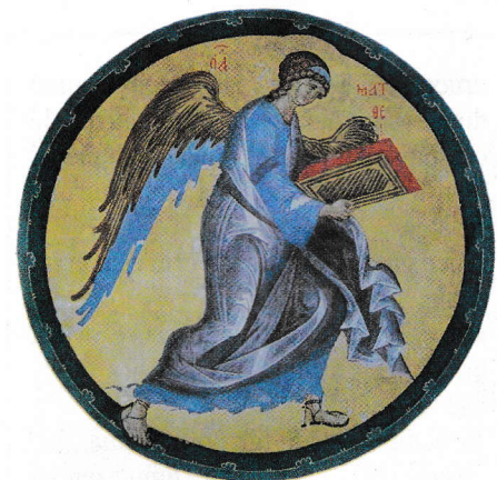
Înger – simbolul Sf. Evanghelist Matei (miniatură de Andrei Rubliov, sec. XIV-XV)