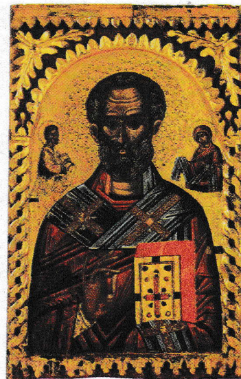
Sfântul Ierarh Nicolae (Mănăstirea Pantocrator, Muntele Athos, sec. XVII)