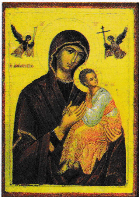
Maica Domnului și Mântuitorul Hristos (icoană, Mănăstirea Vatoped, Muntele Athos, sec. XVI)